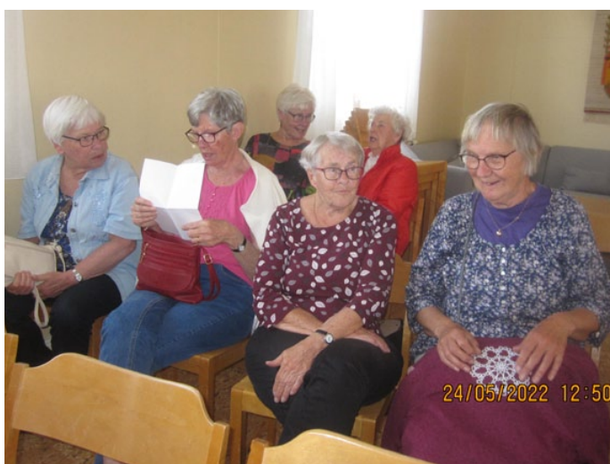
Några av resan deltagare lyssnar till berättelse om kapellet.

Resan gick vidare till Hällekis och Falkängarnas hantverksgata. Resan sista mål var Kinnekulle där utsikten är enorm över landskapet, men var denna eftermiddag höljd i regndis.