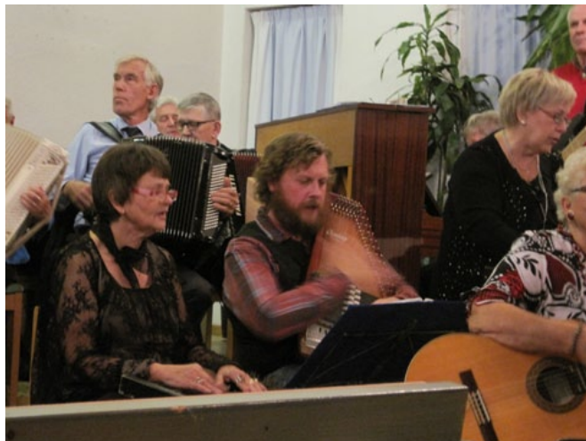
Korsdraget har många musiker