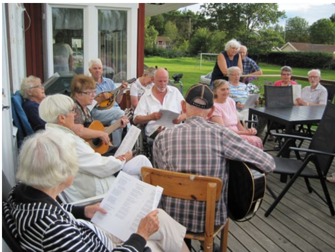
Sång på altan var uppskattat på Lerkilsläget