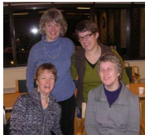
Ledningsgruppen i Bartimaïos.