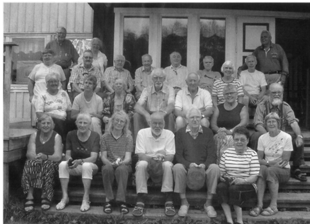
Deltagarna vid gemenskapsdagarna i Lerkil samlade på trappan till lägergården Västkostgården