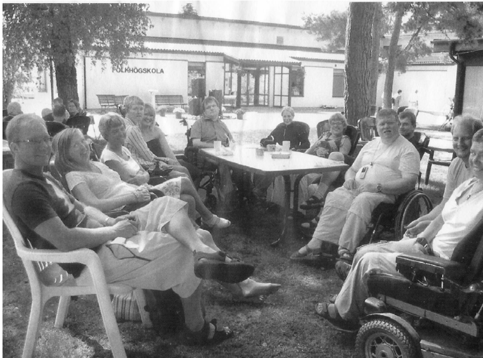
Deltagarna i Livsviktigt kunde också njuta av trädgårdens sköna miljö.

Andakt den 3 aug 2006 i Livsviktigt på Furuboda