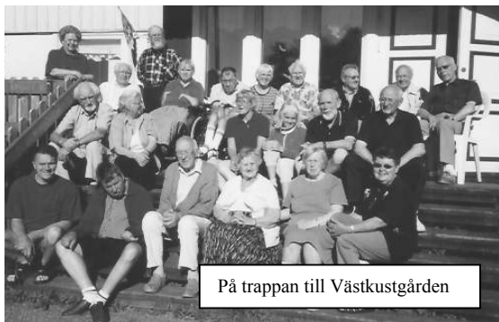
På trappan till Västkostgården

▪ En ny folder med kort information om oss, adresser och kontaktmöjligheter. Den är prydd med den nya loggan som du också ser på baksidan av detta brev. Du kan beställa ett original på broschyren via oss i styrelsen och så kan du kopiera upp ett antal ex på din kopieringsmaskin och kanske göra ett litet tillägsblad