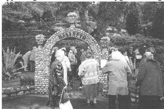
På väg in i Nasaret.

SKrH:s resa startade i regnigt försommarväder. Den fullsatta bussen plus en minibuss styrde färden mot Åsa där vi fick förmiddagskaffe på Kuggaviksgården. Regnet upphörde när vi kom till Åkraberg blomstergården "Nasaret" där vi med guidens hjälp fick uppleva gammal historia från bygden. Många passade